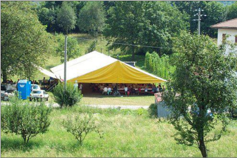
L'affollato tendone della Pro Cervarolo durante il pranzo di ferragosto

menti vari, giochi, animazioni, cultura.