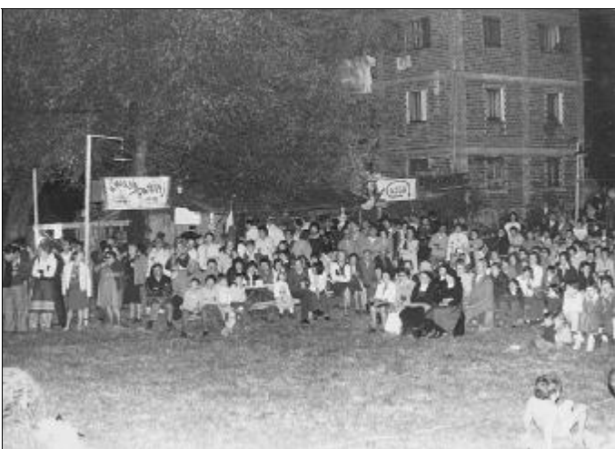
Le prime serate alla Piana, a cielo aperto senza tendone – agosto 1976

Ci sono sempre stati degli alti e bassi, e già nel 1982 le feste d'estate non avevano più tutta quella gente dei primi anni, quando ancora il tendone non era piazzato e le feste si svolgevano a cielo aperto con pochi mezzi.