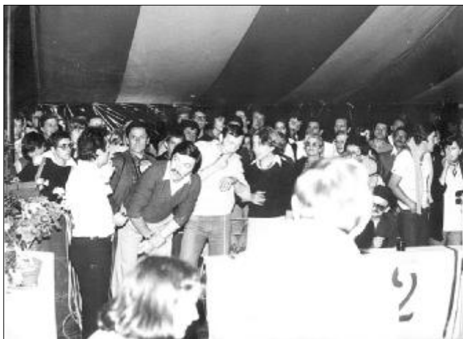
Sotto il nuovo tendone il numeroso pubblico assiste alla serata a quiz – agosto 1977

struita interamente col sasso rosso della regione. La croce in ferro battuto, forgiata gratuitamente dal compianto Pino Vallana. È in quelle domeniche, a tavola dopo il lavoro, tra un bicchiere e l'altro che nasce la volontà di fare altre cose insieme, tutti insieme, anche se ciascuno si trova nei singoli gruppi, comitati. La volontà di pensare "più" in grande. E l'inaugurazione del campanile e della campana delle Piane il 30/5/1976 e la seconda manifestazione ufficiale della nuova Associazione, dopo il carnevale.