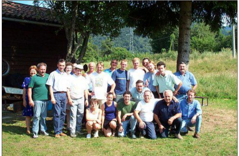
La "squadra" di lavoro al gran completo nella giornata di ferragosto