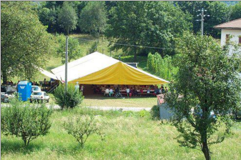
L'affollato tendone della Pro Cervarolo durante il pranzo di ferragosto

menti vari, giochi, animazioni, cultura.