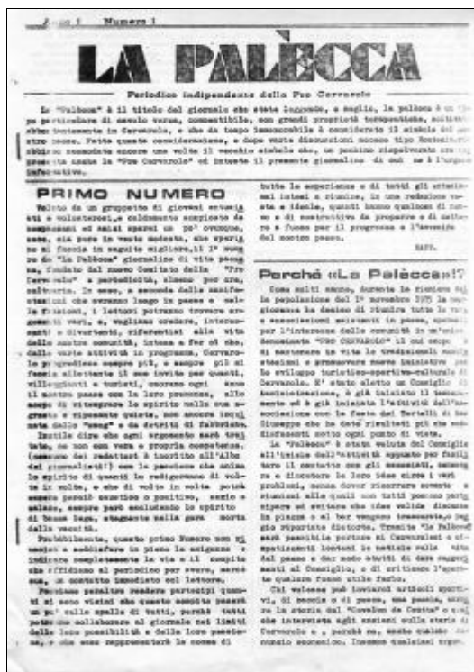
Il 1° numero della Palecca – maggio 1976

atamente in Cervarolo, e che da tempo immemorabile è considerato il simbolo del nostro paese. Fatta questa considerazione, e dopo varie discussioni accese tipo Montecitorio abbiamo scomodato ancora una volta il vecchio simbolo che, un pochino rispolverato ora rappresenta anche la "Pro Cervarolo" ed intesta il presente giornalino di cui ne è l'organo informativo".