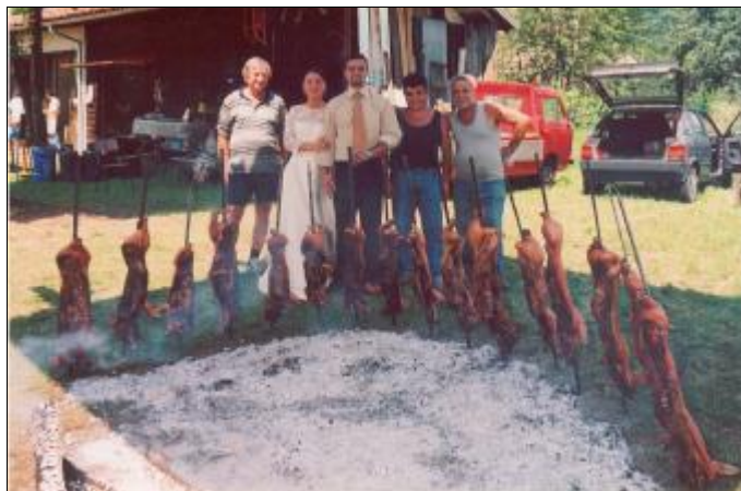
Dopo diverse ore di cottura a fuoco lento, così come usano i pastori sardi, i "purceddi" sono quasi pronti