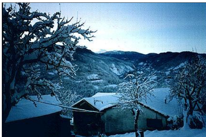
Paesaggio invernale nella zona di Villa Minozzo (RE)

Cervarolo" non hanno in comune solamente il nome, ma anche gli altri aspetti che li caratterizzano, sono molto simili. Pare che a Cervarolo dell'Emilia vi sia anche una