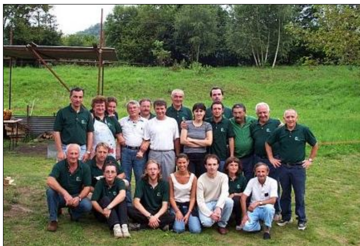
Lo staff al gran completo durante la Festa del Fungo