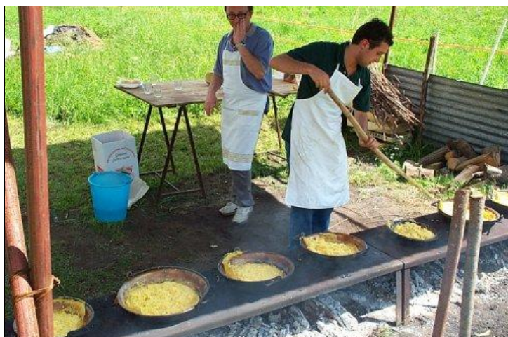
Al lavoro per la preparazione della polenta

Per fortuna nei giorni successivi il tempo ha messo giudizio così da portare a termine le manifestazioni in programma senza più alcun "intoppo meteorologico". Serate musicali, anche con orchestre importanti, la tombola, la lotteria con ricchi premi, i giochi (curati dalle Cow-Girls), pranzi e cene (tra cui quella a tema, vale a dire ... del cavolo, riuscitissima), insomma una varietà di intrattenimenti in grado di poter accontentare i numerosi frequentatori del tendone.