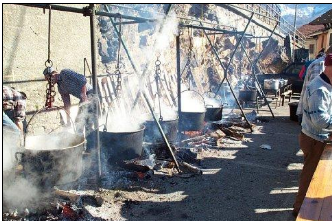
Fuochi accesi e caudere fumanti: fra poco la paniccia sarà pronta

Una tradizione tramandata di generazione in generazione, come la sua ricetta ed il modo con cui viene preparata; così come le grandi caudere di rame, anche loro da decenni a "sopportare" il fuoco, a volte lento a volte violento, per ore ed ore. Ed ecco che alle 17.00, puntualmente ed