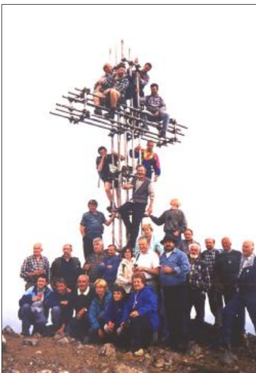
Ai piedi della Croce per l'ultima foto

Appuntamento dunque all'anno prossimo, questa volta per lavorare, anche se siamo sicuri fin d'ora, che non ci si lascerà scappare l'occasione per festeggiare e brindare ad un amicizia che ha un'amica comune, la Croce della Massa, la nostra Croce.