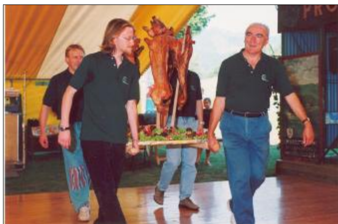
Sul palco arrivano i maialini, portati dai camerieri della Pro, pronti per essere consumati