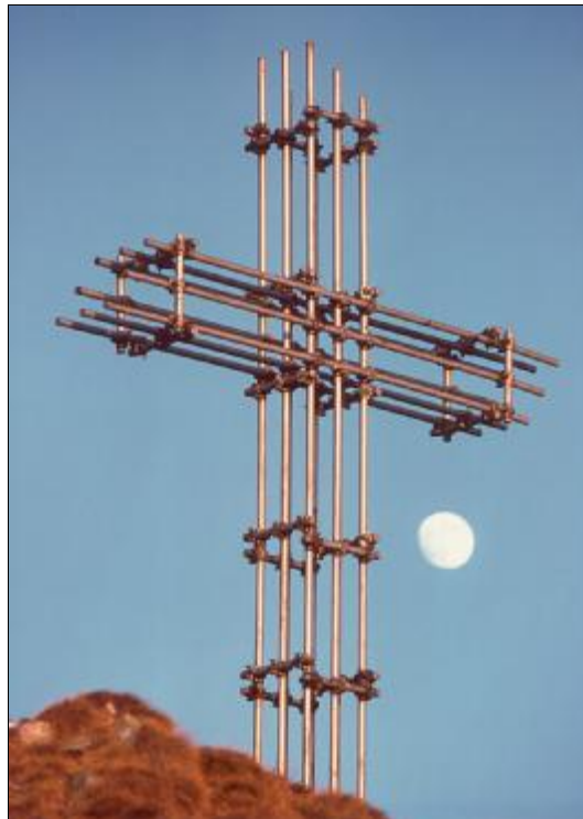
La croce inaugurata nel giugno 1982

Ed è così che verso primavera la Pro Cervarolo ha avviato i contatti con gli amici della Valstrona, con la speranza di incontrare anche da parte loro la voglia di ritrovarsi lassù, a duemila metri.