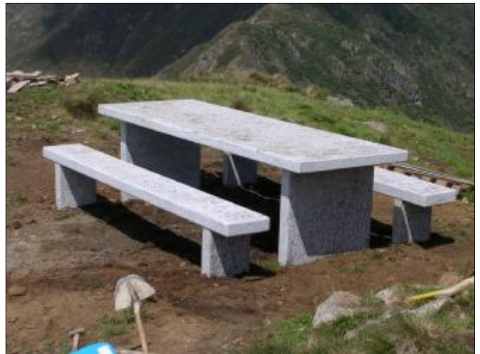
E voilà... il tavolo è pronto

(22 diviso 2 uguale 11, i conti tornano). Nel frattempo l'elicottero sta portando un primo carico di materiale (acqua, sabbia, cemento), mentre con il secondo sarebbero dovuti arrivare gli attrezzi da lavoro.... Sarebbero, poichè gli attrezzi non sono mai arrivati, persi per strada, anzi per aria, in chissà quale cengio o canalone. "Vorrei proprio sapere chi ha preparato il carico!!". Meno male