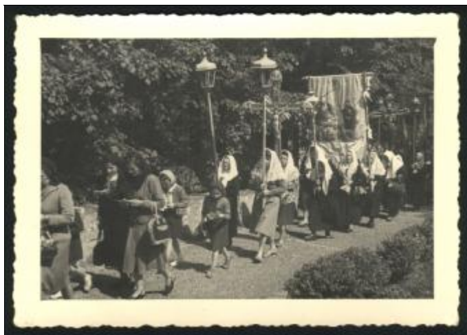
La Compagnia Bianca e di seguito la Compagnia Blu

Oggi comunque può essere ritenuta valida ai fini della sola conoscenza poiché per le poche processioni ancora in auge trovare "quattro gatti" è già un miracolo e pur conoscendo un tale rigoroso ordine è impossibile riproporlo.