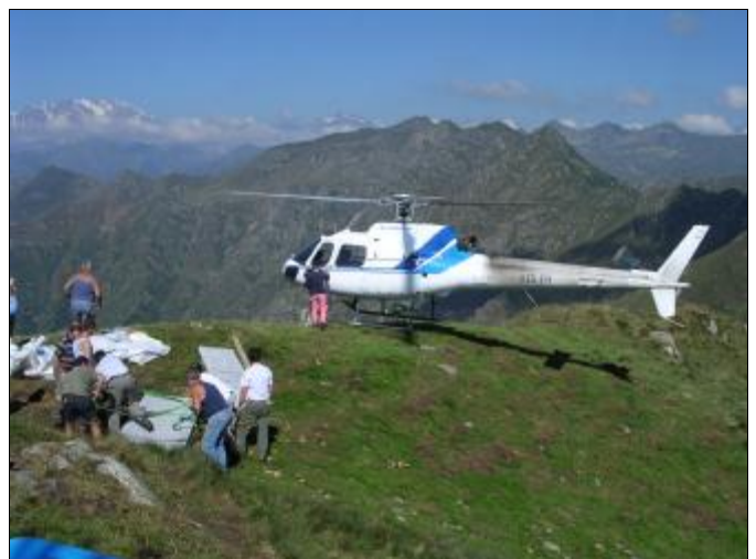
L'ultimo saluto, e l'elicottero si alza in volo per tornare alla propria base.