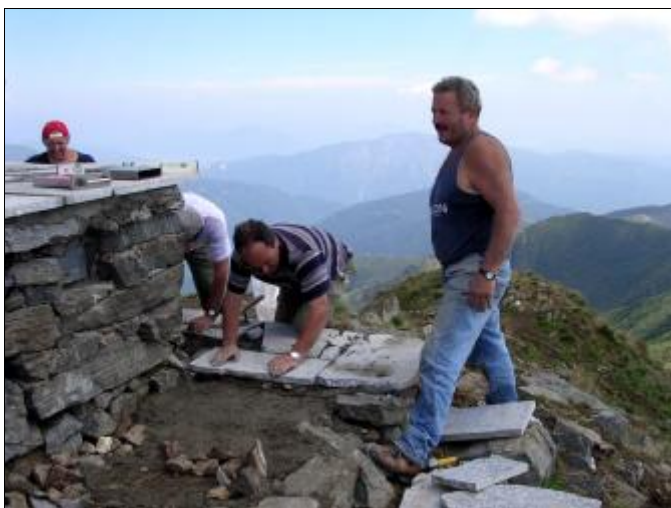
Si lavora anche alla sistemazione del basamento della croce

dal tranquillo pisolino che nel frattempo stavamo schiaggiando. Finalmente arriva l'elicottero con il primo carico. Nel giro di pochi minuti tutti i pezzi del tavolo sono in vetta e si può procedere con la posa. Livello alla mano in un attimo le gambe sono salde al terreno e via con il resto. Altre persone nel frattempo si dedicano alla sistemazione del basamento della croce, da troppi anni in balia delle intemperie e del gelo. Ore 13 pausa pranzo... e giù telefonate e dialoghi alla radio con i rispettivi campi base (la morosa, la moglie, la mamma... ). "Tèi mangià, tèi bevù, a fà frecc, a fa caut, al ghè 'sol, al ghè la lùna, tèi stracc... ". Per digerire il