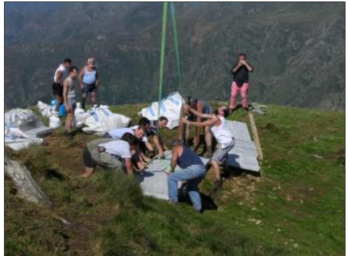
E' l'ultimo viaggio, il tavolo è in vetta