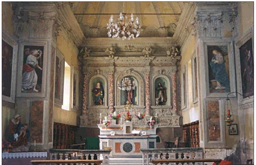
L'interno della Chiesa

Il duplice evento ha riunito i Cervarolesi che hanno voluto porgere al loro parroco tanti auguri affinché gli vengano concessi ancora molti anni di ministero ed esprimere alle sorelle Dameno tutta la loro sentita riconoscenza, nel sentimento di stima ed affetto che li lega a chi sentono intimamente vicini in una vera comunione d'intenti.