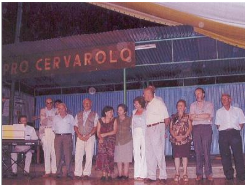
Alcuni poeti presenti alla nostra rassegna dialettale