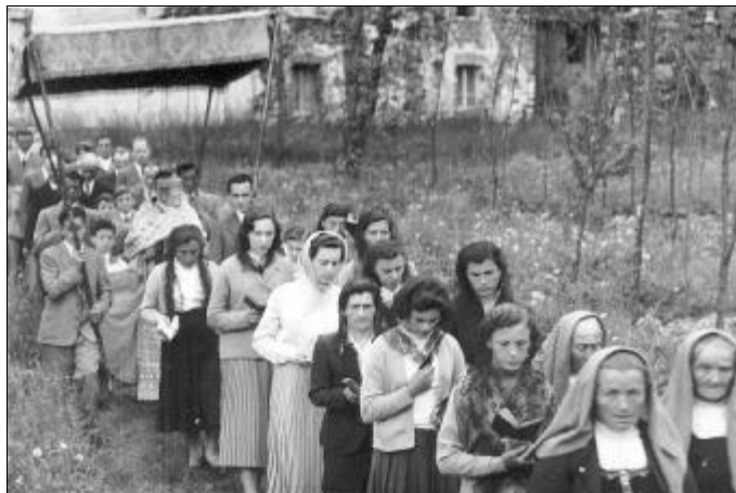
Fotografia "più recente" - siamo intorno agli anni '60

E anche le non più giovani partecipanti convergevano su un'unica certezza: che la croce e le torce piccole e rosse aprivano la