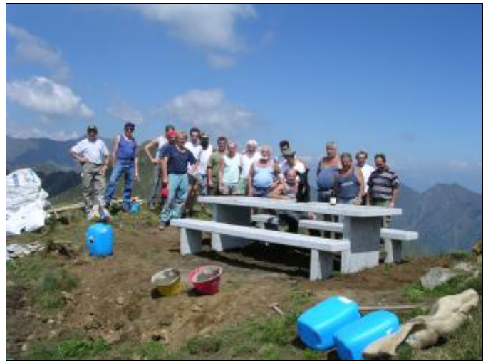
Foto di gruppo intorno al tavolo quasi ultimato