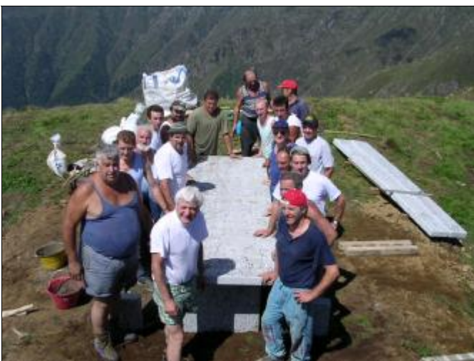
Pezzo dopo pezzo il tavolo... prende forma

to dura troppo poco, tanto che non facciamo in tempo a capire dove siamo che già ci apprestiamo ad atterrare a quota 1959. Nel frattempo l'elicottero prosegue con gli altri volontari, "I sambuogogn". Alla fine i lavoratori in vetta sono 22 (4+18), esattamente quanto due squadre di calcio