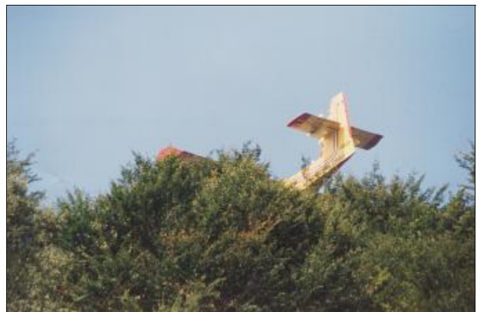
Il Canadair sfiora le punte degli alberi, dopo aver sganciato i 6000 litri di acqua dal suo serbatoio

E le conseguenze non si sono certo fatte attendere. La mancanza di pioggia pressoché totale ha portato al rinsecchimento di tutte le fonti naturali che si trovano a Cervarolo, anche di quelle che mai si erano prosciugate. Per rivedere di nuovo scorrere l'acqua si è dovuto attendere in molti casi la fine di Novembre. Nel mese di Agosto, coincidente con la maggior presenza turistica, si è arrivati al razionamento dell'acqua potabile, ed il rifornimento con le autobotti dei bacini di raccolta. Ma non solo; un'altra conseguenza, non diretta ma che con la siccità si è manife-