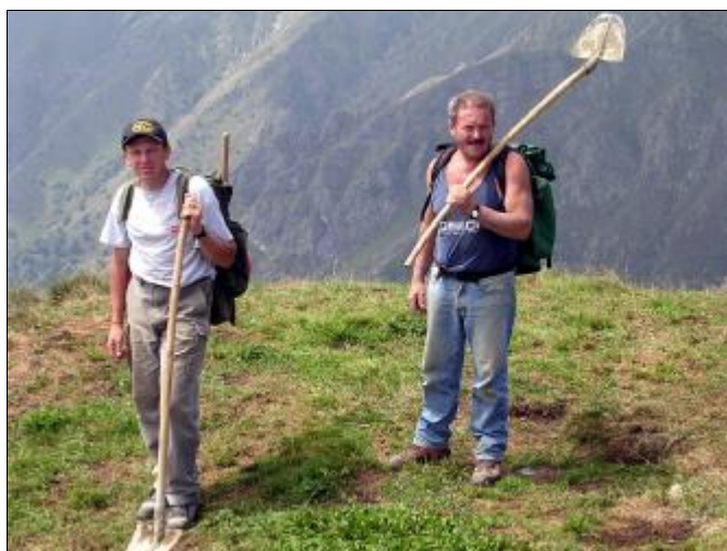
Due dei "nostri", si apprestano ad affrontare la discesa, questa volta a piedi. Il lavoro è terminato