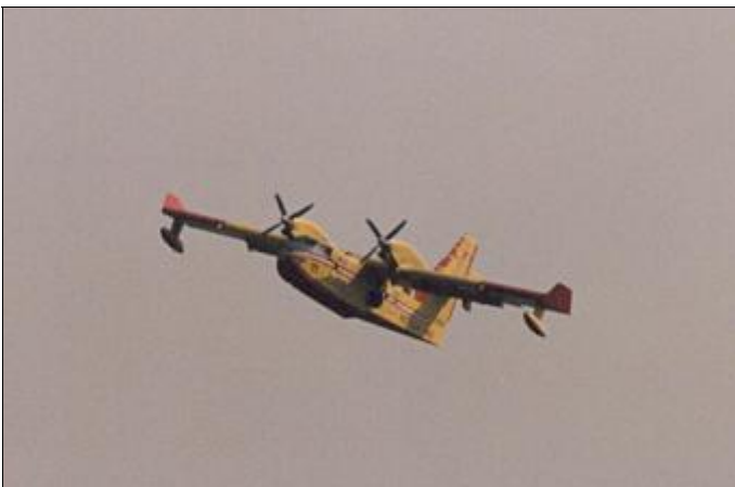
Il Canadair impegnato nell'incendio alle Piane

stata in maniera più marcata, è il grande incendio che proprio nei giorni di maggior calura si è sviluppato a ridosso delle Piane di Cervarolo. Sviluppatosi nella giornata dell'11 agosto (guarda caso l'11 è stata la giornata in cui si è rilevato il picco di temperatura dell'estate) da origini probabilmente naturali, si parla di fulmini nei giorni precedenti, in poco tempo dalle pendici a ridosso di Salaro/Erbareti nella Val Sabbio-