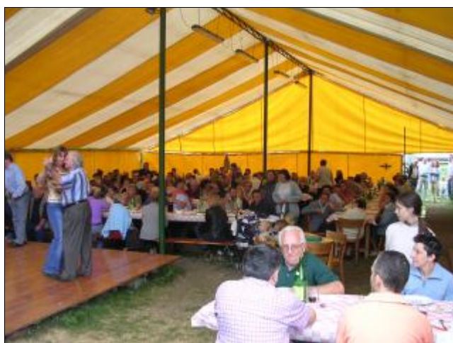
Il pranzo e .... quattro salti sulla pista da ballo

Proprio per accontentare tutti i gusti, non sono mancate le consuete serate musicali e danzanti, e le cene al campo (anche la bocca vuole la sua parte), in un clima decisamente tropicale, in antitesi rispetto all'anno precedente, quando