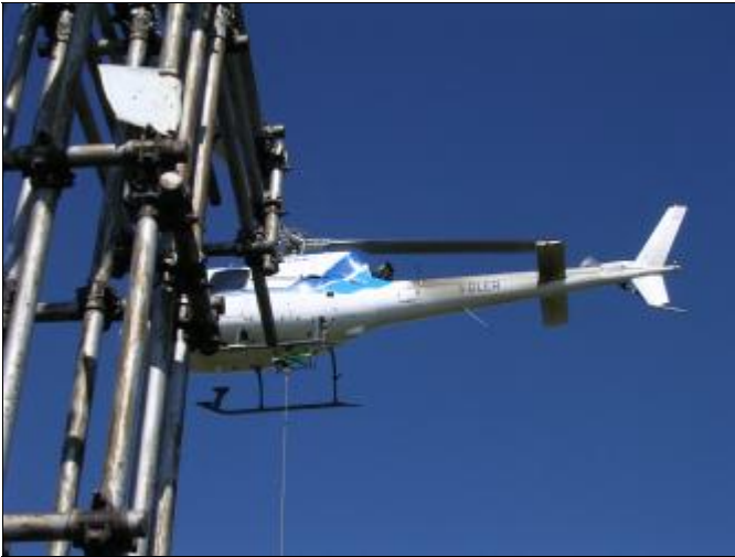
L'elicottero a pochi metri dalla croce sta posando il materiale necessario