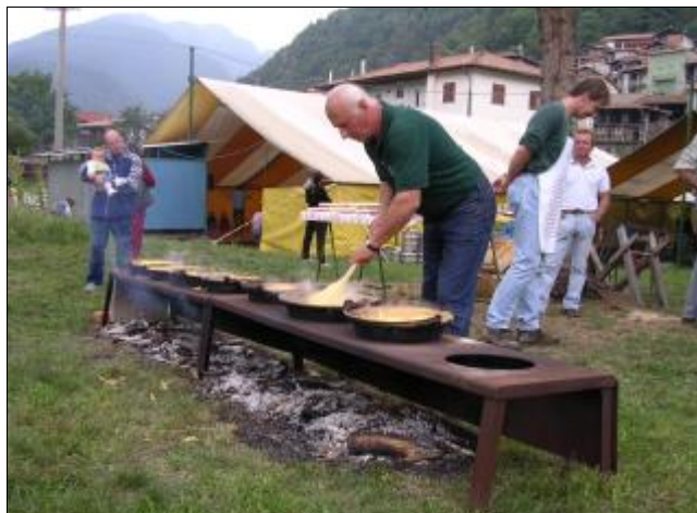
Festa del Fungo: la preparazione della polenta

Estate, precisamente Festestate numero 28; apertura tendone in occasione della seconda edizione della Festa della Birra, 26 e 27 luglio. Una festa che possiamo definire un po' sottotono; va beh!!, ci abbiamo provato ancora, peggio per chi non c'era..... E arriviamo al 2 agosto, serata teatrale in grande stile con la Compagnia del Mirtillo a proporci la commedia "Non tutti i ladri vengono per nuocere" scritta nientemeno che da Dario Fo, per la regia di Beppe Colombo. Tendone gremito e consensi unanimi per un appuntamento culturale che non è stato l'unico in questa estate 2003, visto che il Venerdì successivo si è organizzata la 4 a rassegna di poesie dialettali (Al mè pais... il titolo della serata), di cui invitiamo a leggerne i dettagli nell'articolo dedicato.