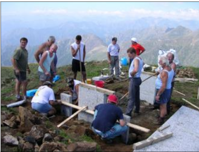
Si lavora per la posa delle gambe del tavolo

to dura troppo poco, tanto che non facciamo in tempo a capire dove siamo che già ci apprestiamo ad atterrare a quota 1959. Nel frattempo l'elicottero prosegue con gli altri volontari, "I sambuogogn". Alla fine i lavoratori in vetta sono 22 (4+18), esattamente quanto due squadre di calcio